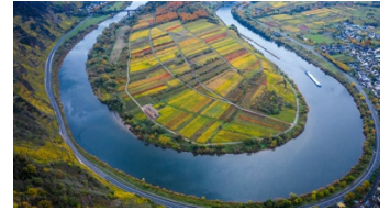
Die Moselschleife bei Bremm

an dem die Rheinland-Pfälzerinnen und Rheinland-Pfälzer über die Verfassung abgestimmt und den ersten Landtag gewählt haben.