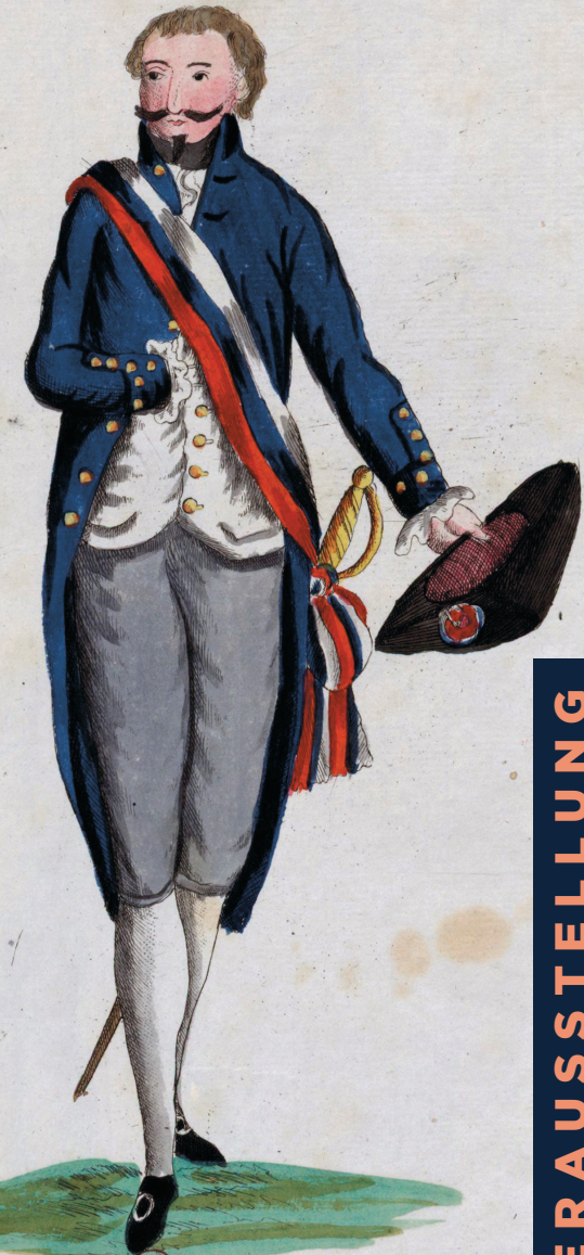
Ein Deputirter bey dem National-Convent in Maynz.